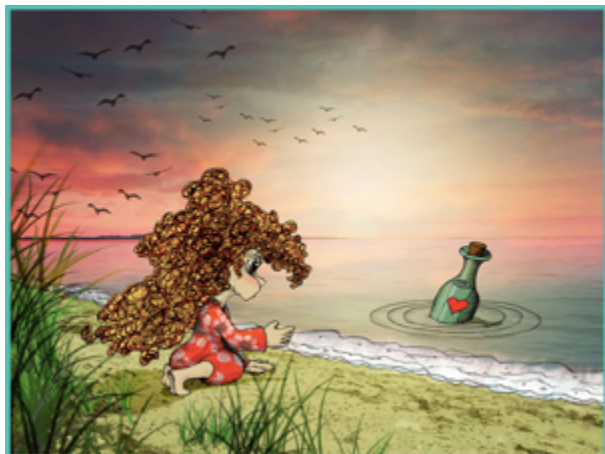
Undrekort med Sigrid og flaskeposten

Lad børnene sidde i rundkreds, så de alle kan se undrekortet med Sigrid og flaskeposten .